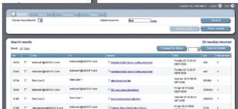
Datosphere User Search