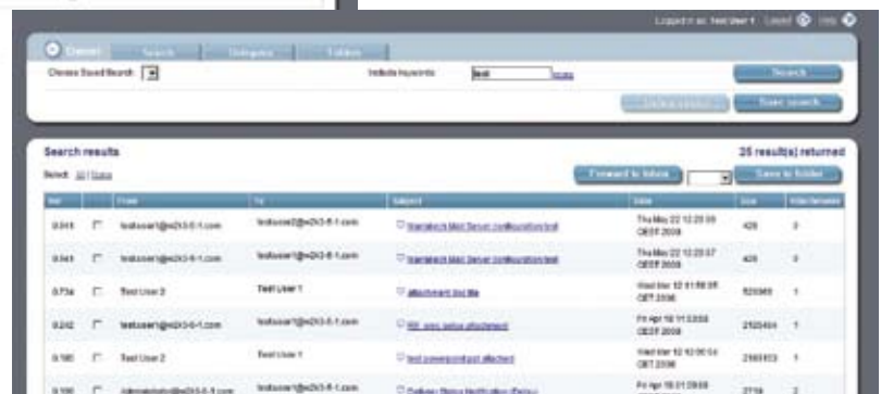
Datosphere User Search